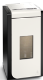
Termostufe a pellet MINERVA HYDRO