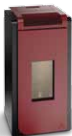
Stufe a pellet MINERVA AIR