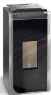
Stufe a pellet AFRODITE AIR