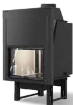
Termocamini a legna SUPERIOR SUPERIOR PLUS