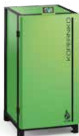
Caldaie a pellet KOPERNIKO