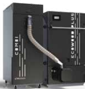
Caldaia a legna/pellet ECOWOOD PLUS + BRUCIATORE A PELLETTA ROTANTE