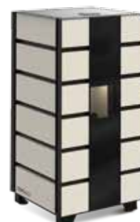
Termostufe a pellet PENELOPE PLUS