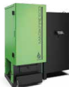
Caldaie Policombustibili MAGIKFIRE ECO