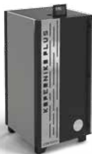
Caldaia a pellet KOPERNIKO PLUS