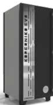
Caldaia a pellet KOPERNIKO EVO