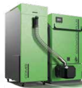
Caldaie a legna/pellet ECOWOOD PLUS + BRUCIATORE A PELLETT ROTANTE