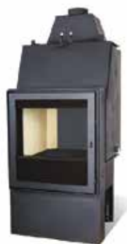
Termocamini a legna DELUXE