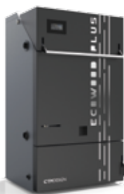
Caldaia a legna ECOWOOD PLUS