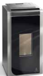
Termostufe a pellet AFRODITE HYDRO