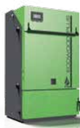
Caldaie a legna ECOWOOD PLUS