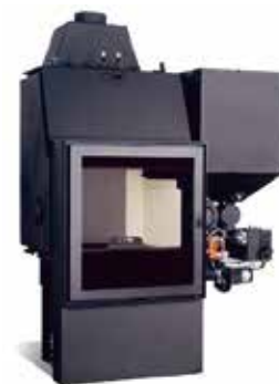
Termocamini Policombustibili DELUXE PRO