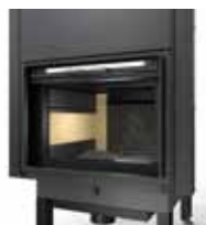
Apertura a scomparsa verticale per il caricamento della legna