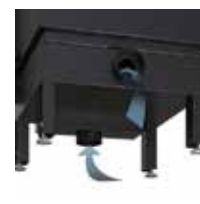
Ingressi separati per aria primaria e secondaria