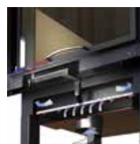
Sistema di gestione e regolazione dell'aria di combustione