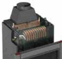
Scambiatore integrato polivalente FULL LINK