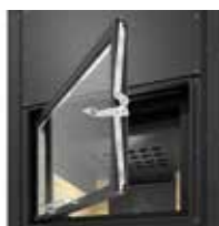
Apertura a bandiera per la pulizia del vetro